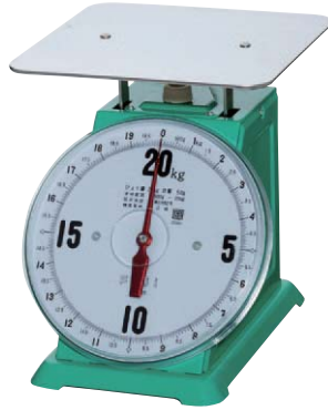
AK型 平皿 20kg