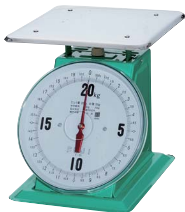
E型 平皿 20kg