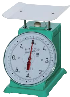
K-1型 平皿 8kg