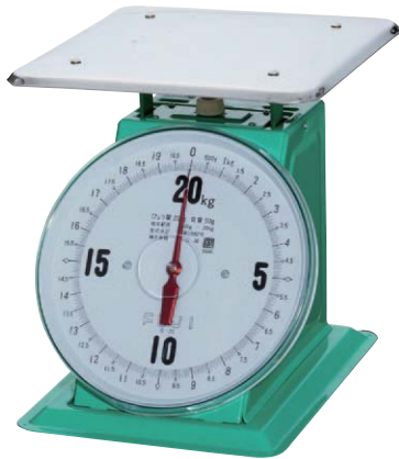
E型 平皿 20kg