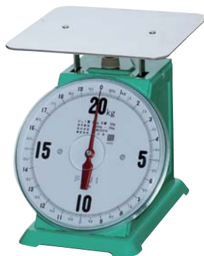
AK型 平皿 20kg