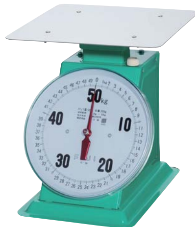
O型 平皿 50kg