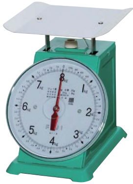
K-1型 平皿 8kg