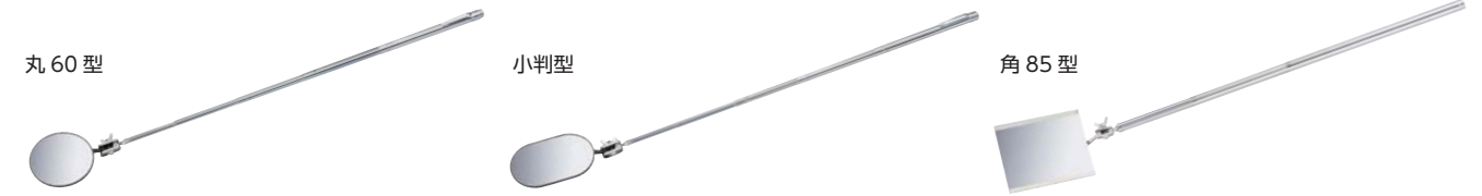
角 85 型